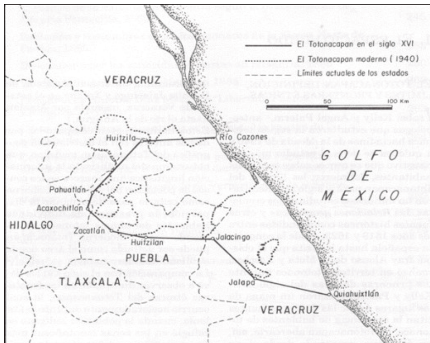
Figura 3.3. Extensión aproximada del Totonacapan (Siglo XVI - 1940)