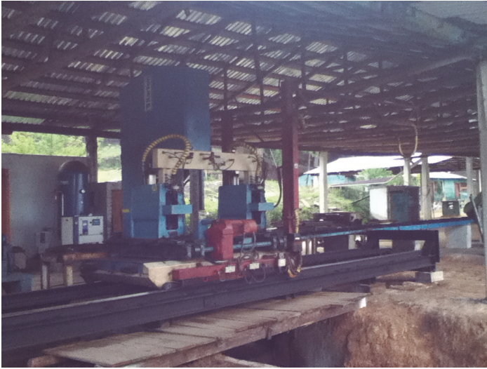
Figura 3. Aserradero del paraje de Las Vigas.

generando tensiones internas, y con poca transmisión del conocimiento del manejo y aprovechamiento forestal; quedando en pocas personas expertas. Como resultado, Pueblos Mancomunados se separa de la UCEFO.