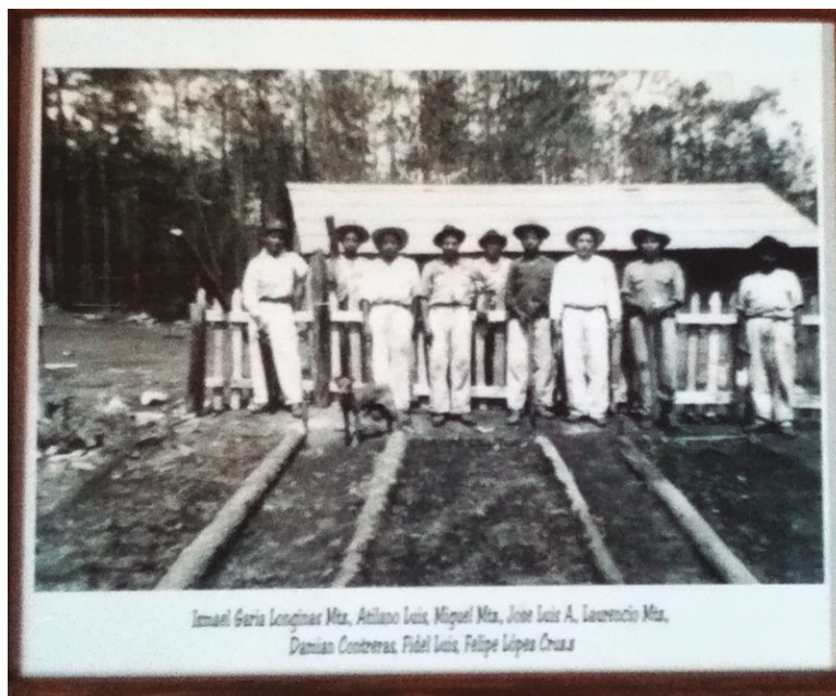
Figura 2. Trabajadores de la empresa forestal en la agencia de Llano grande. Tomada de la agencia municipal de Llano Grande, octubre de 2014.

aprendieron técnicas forestales como el uso de serrones, ganchos, cubicación de madera y posteriormente motosierras y grúas, gracias al intercambio de conocimiento con los trabajadores procedentes de Michoacán y los mismos técnicos forestales (fig 2). La convivencia entre los trabajadores provenientes de Michoacán y los habitantes de Oaxaca era notablemente cercana, lo que permitió la creación de lazos familiares e incluso el traslado de residencia a los Pueblos Mancomunados.