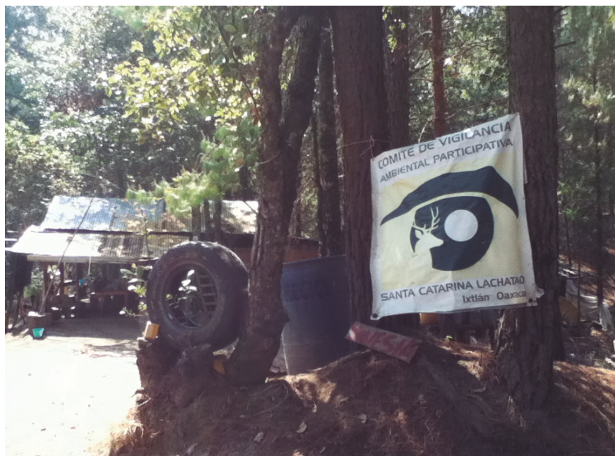
Figura 5. Caseta al interior del mancomún, del comité de vigilancia participativa de Santa Catarina Lachatao.

acusaban que la plaga era un pretexto para aumentar la tala, mientras otros defendían la conservación— agudizaron la fragmentación del mancomún. 62