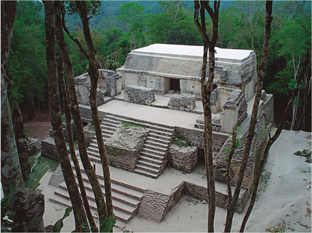
Figura . Nakum, Edificio N restaurado en el año 2005, vista desde el Edificio Y.

varios sitios arqueológicos, para registrar avances o desiertos en el manejo del patrimonio edificado prehispánico (Figura 5).