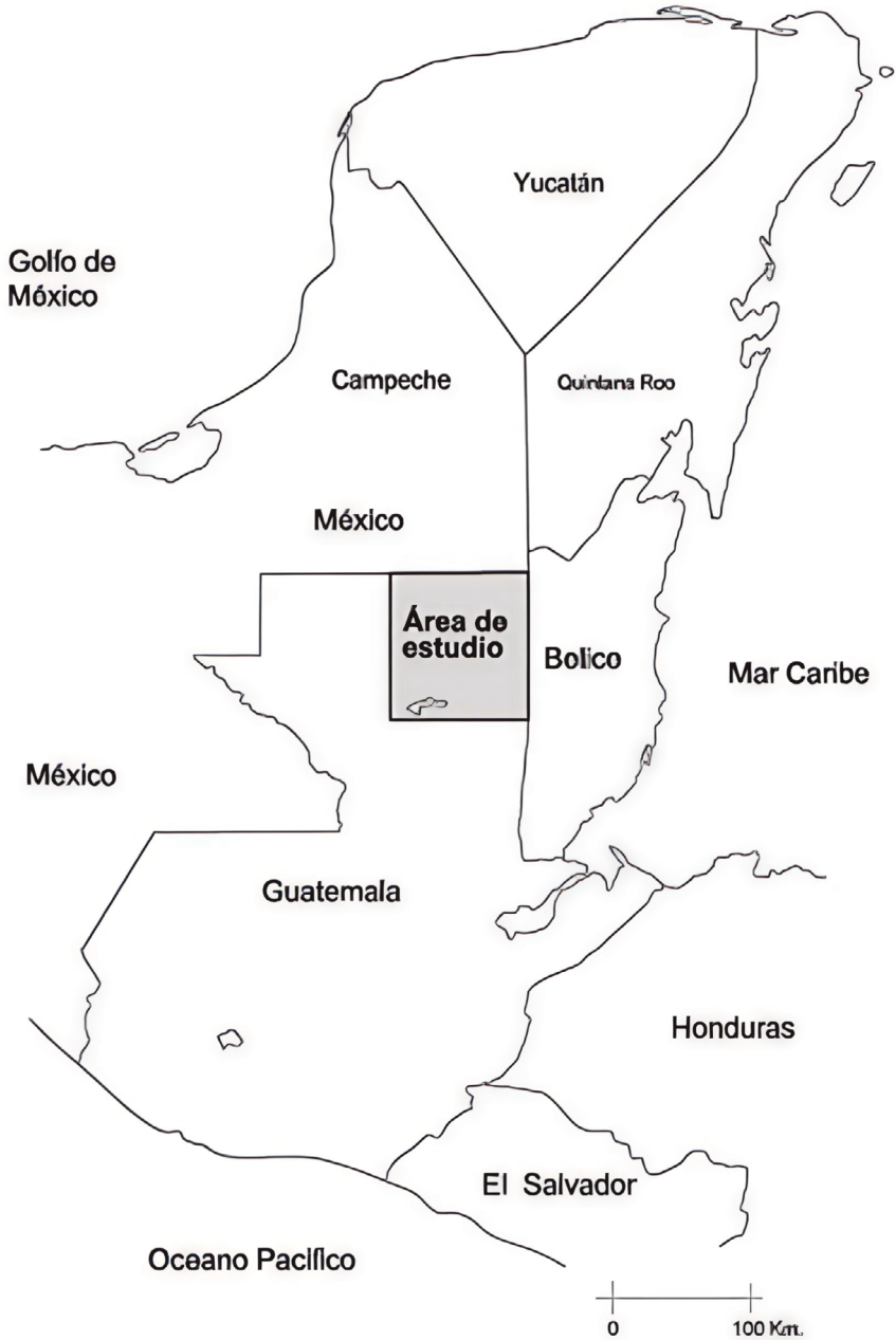
Figura 1. Localización de área de estudio. Diseño y elaboración de Raúl Noriega Girón y Óscar Quintana.