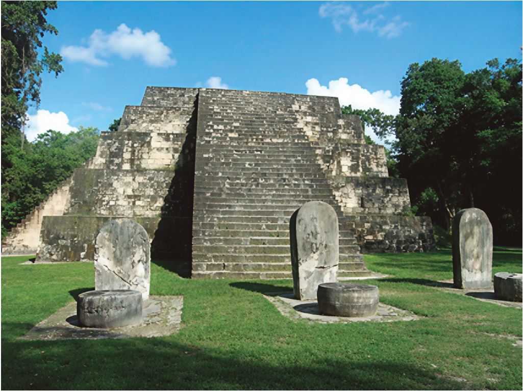
Figura 2. Tikal, Primera intervención restaurativa, grupo Q, pirámide gemela 4E-36, del Museo de la Universidad de Pensilvania en 1959. Foto de Raúl Noriega, 2013.

pensó en iniciar los trabajos en Tikal, pero por diversas razones la decisión se retardó (segunda guerra mundial). En la década de los cincuenta, Tikal ofrecía un panorama selvático, abandonado y sin comunicación. Una pista de aterrizaje para avionetas y DC-2 fue preparada en 1951. En esa época, el norte de Guatemala usaba el sistema de pistas para avionetas que comunicaba por aire a seis poblados aislados en la selva. Asentamientos que se dedicaban a extraer y recolectar el látex del árbol chicozapote ( Manilkara zapota ) para producir chicle. Época de oro del chicle natural de primera. Muchos vecinos mexicanos trabajaron en esta tarea y Tenosique, en Tabasco, fue un importante centro de acopio.