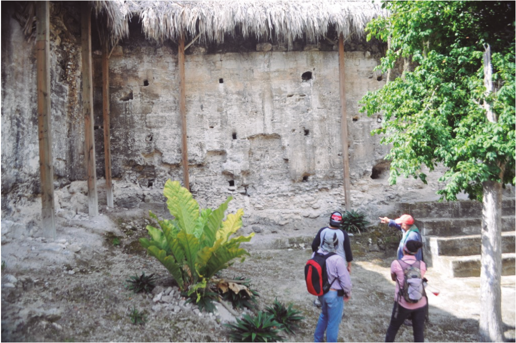
Figura 6. La Blanca, Edificio 6J2 con ambientes monumentales.

En los dos sectores encontramos innumerables vestigios de ciudades prehispánicas aun no identificados totalmente. La riqueza arqueológica de la zona del estudio es majestuosa y especial. El conjunto forma uno de los enclaves urbanos más densos generado por una de las culturas más espectaculares de la América precolombina. De igual valor es su patrimonio natural, la selva tropical húmeda más grande de Guatemala, que junto con sus vecinos Belice y México (Reserva de Biosfera de Calakmul) forman una de las zonas, de selva tropical protegida, más importante del mundo.