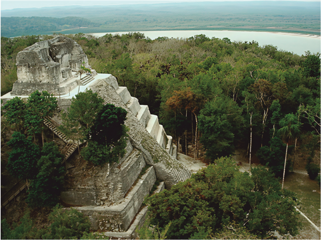
Figura 3. Yaxhá, vista del edificio principal 216 en la Acrópolis Este, frente a la laguna Yaxhá. Imagen de Raúl Noriega Girón.