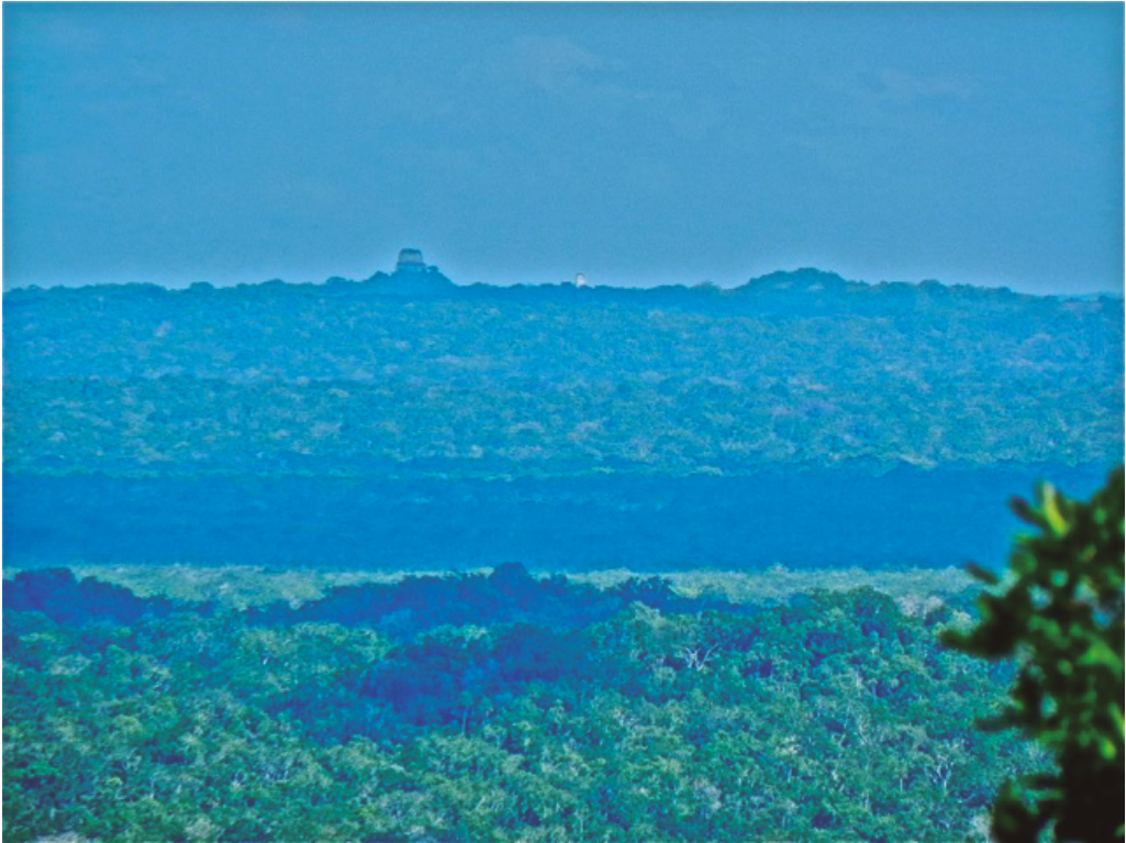
Figura 9. Vista desde el sitio arqueológico del Zotz, hacia el parque y zona arqueológica de Tikal. Foto de Juan Antonio Siller Camacho, 2012.

Por varios años y en distintas publicaciones se ha tratado de documentar la situación del patrimonio edificado en la zona; el objetivo de estos documentos es tratar de dar a las autoridades (MCD) indicadores o parámetros de manejo en este territorio.