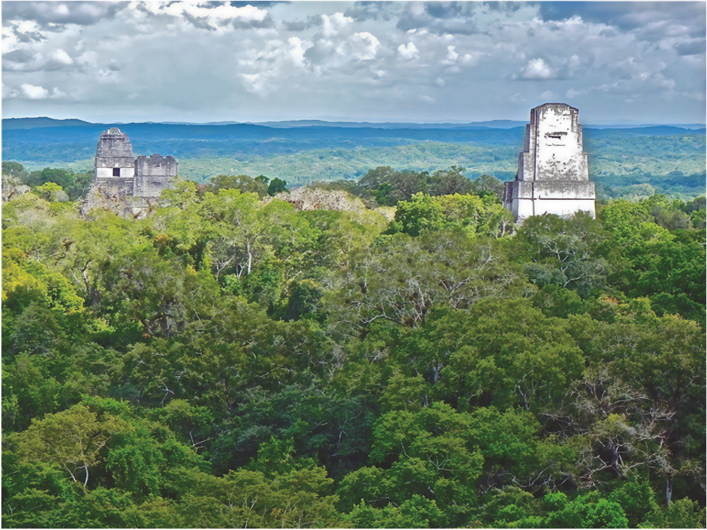
Figura 7. Conjunto de templos en Tikal y cubierta de la selva en el sitio arqueológico. Foto de Juan Antonio Siller Camacho, 2012.