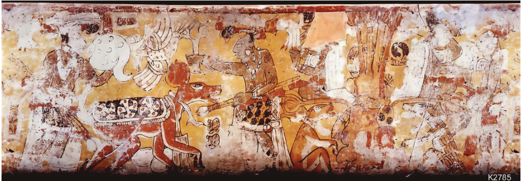
Figura 14. Detalle del Vaso de Calcehtok colección Ancient maya Art at Dumbarton Oaks. Foto. Justin Kerr K2785.

unas lanzas en su mano diestra, y un caracol que parece está soplando, en la otra. Otro actor frente al venado también sostiene unos lanzones y empuña las astas del cérvido que parece él arrancó. Más allá, se presenta un árbol fantástico, posiblemente una ceiba, con un tronco antropomorfo, de cuya fronda descende una serpiente. En cada rama lateral se ven dos personajes sentados, mientras que al pie de la misma reposan dos venados semihumanos. Ambos son cautivos de la misma cacería, quizá representando el alter ego de los dos personajes superiores (Figura 14).