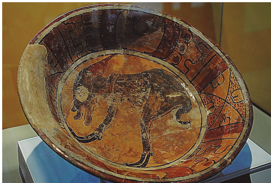
Fig. 16 Plato con un venado cola blanca muerto. Fue encontrado marcando el entierro del cuarto 2 del edificio de las pinturas en Bonampak. Sala de exposiciones temporales Museo Regional de Chiapas.