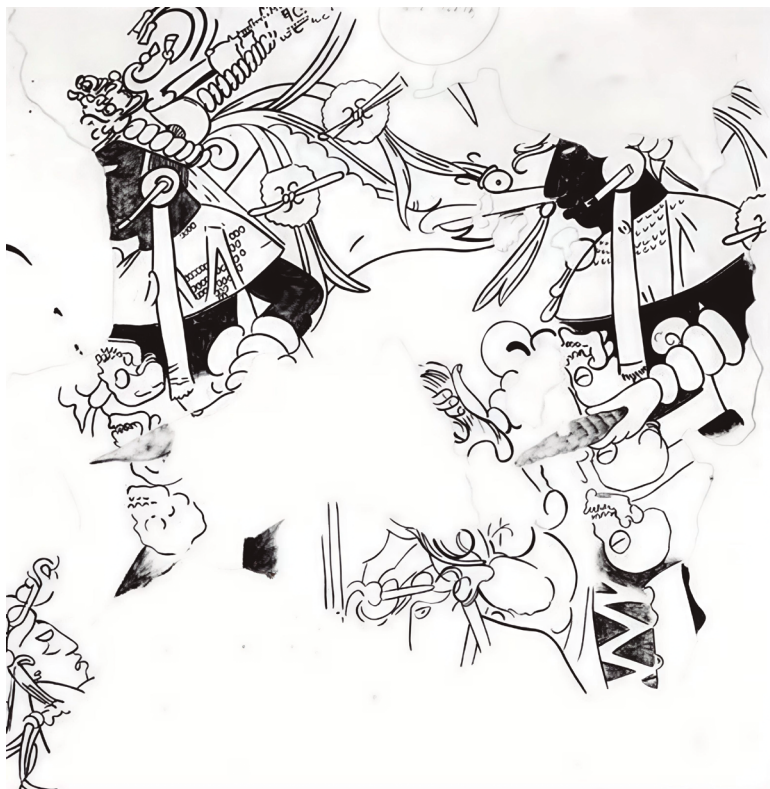
Figura 6. Aj Kéej en los murales de Mulchic. Dibujo de Román Piña Chan.