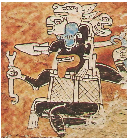
Figura 5. Dios M como guerrero-cazador con una toca con cabezas de venado y tortugas. Códice Madrid M51. (Ayala 1999).