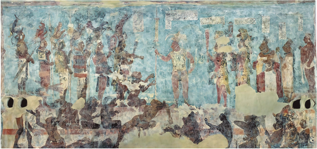
Figura 9. Escena de los 7 señores del venado con el cautivo frente a Chan Moan II y su familia. Cuarto 2 Edificio de las Pinturas, Bonampak, Chiapas.