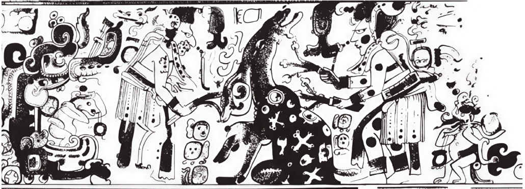
Figura. 13 Detalle de un vaso policromo con una escena mitica con los gemelos sagrados. Dibujo de Dianne Griffiths Peck.