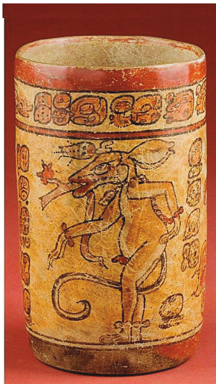
Figura 15. Venado con una rama florida en su hocico y una flore que brota de su asta. Colección particular.