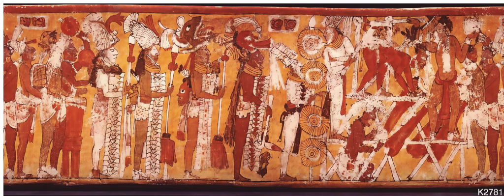
Fig. 7 Detalle del vaso del entramado. Nótese el escudo que portan frente al pecho realizado a base de telas blancas amarradas. Foto Justin Kerr K2781. Colección Dumbarton Oaks Washington DC PC.B. 594.