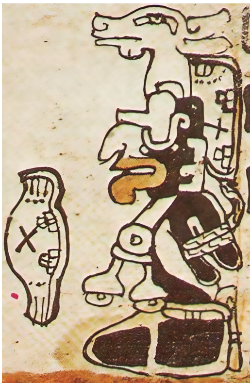
Figura 4. Dios M prisionero con un tocado de venado. Códice Madrid M68. (Ayala 1999).