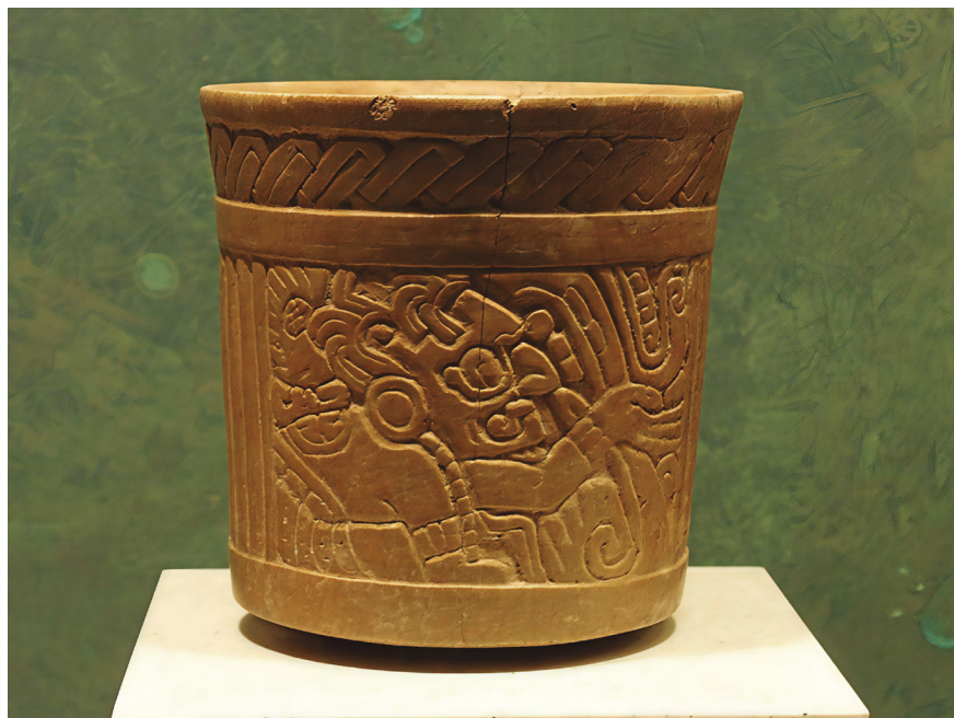
Figura 1. Vaso del dios solar con una pequeña barba de "bagre" Museo Nacional de Antropología e .Historia, México, Foto. José Manuel Chávez, 2004.