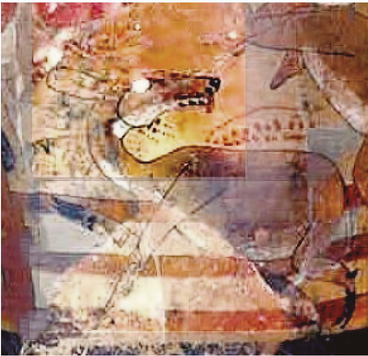
Figura 12. Detalle del Vaso de la Cueva de Actún Balam, Belice.

El venado representado en Ek' Balam se asemeja mucho en la posición, y en la manta que lo cubre, a tres vasos: el de Calcehtok, Actún Balam (Figura 12) y el vaso policromo de los héroes gemelos y el venado (Figura 13). Lo que tienen en común es la representación de un venado muerto o agonizante y que se cubre con la manta mortuoria para acceder al inframundo.