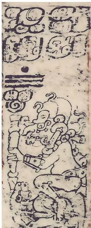
Figura 3. Dios B Cháak montado sobre un venado. Códice Dresden 59c (Ayala 1999).