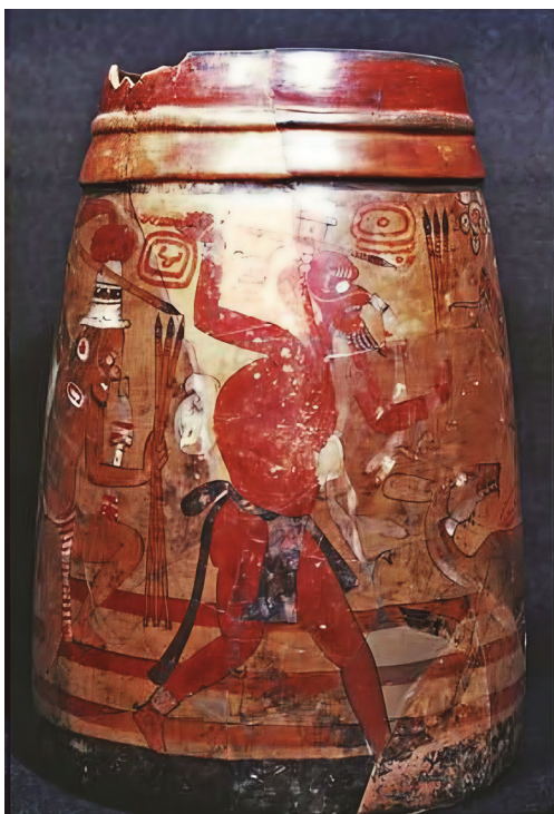
Figura 2. Vaso de la Cueva de Actún Balam, Belice.