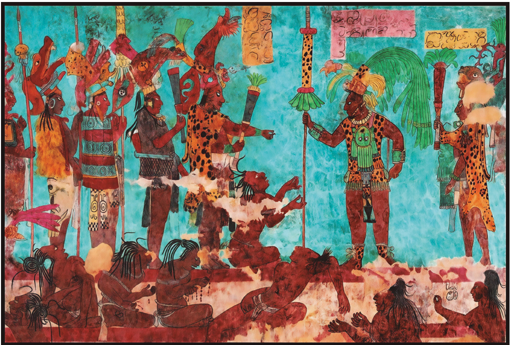
Figura 10. Los wúuk zip. Detalle del Mural de la Batalla, Sitio arqueológico de Bonampak, Chiapas.